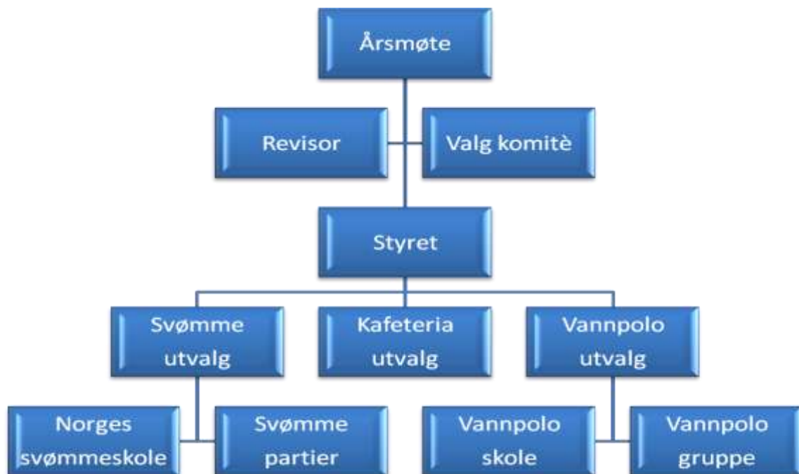
Figur 2 LRK's egne organsiasjonsledd